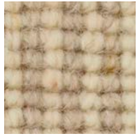
hellbeige mittelbeige 4143