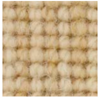
hellbeige sisal 4152