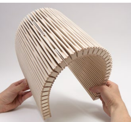
4/4 mm, 3-layer spruce